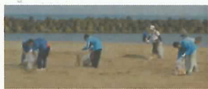
クリーンビーチいしかわ (専光寺海岸沿いの浜辺)