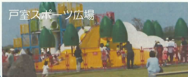
戸室スポーツ広場

なかよしサイクル等の遊具と少年野球で9,355名、戸室スポーツ広場では、大型遊具の戸室夢空間と少年野球で6,113名計15,468名の来場者がありました。