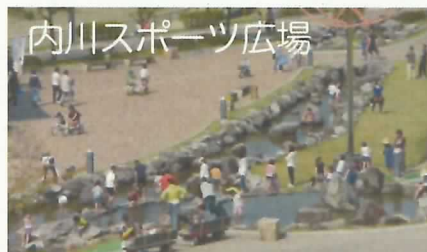
内川スポーツ広場

4月29日(火・昭和の日)から5月6日(火・振替休日)までのゴールデンウィーク期間中、「安・近・短」を求めて例年、家族連れで大賑わいとなりますが今年も内川スポーツ広場のレインボーモービル、