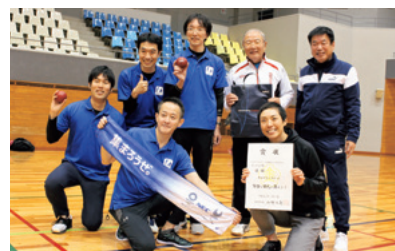
ボッチャ優勝「野田中陸上部B」と特別ゲストのNECボッチャ部