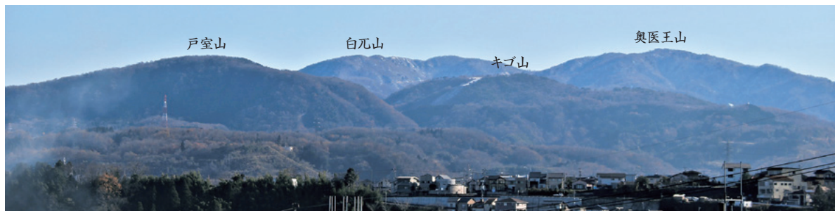
金沢市大桑町上猫下付近より撮影

※様々な文献や金沢市史等を調べましたが、確証を得られなかった部分もあります。ご了承ください。