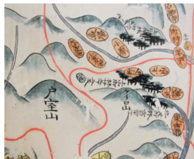
河北郡図 金沢市立玉川図書館蔵

医王山スキー場ペアリフト終点がある頂上の展望台からは、富山方面、白山、日本海、宝達山までぐるりと一望できます。