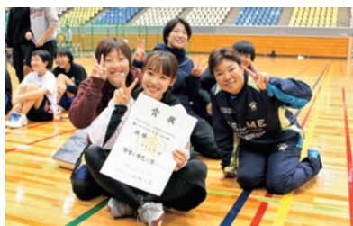
車いすバスケットボール優勝「クラカ」

これまでの体験会に加え、今回は参加チームを募り、トーナメント形式の交流大会を開催しました。ボッチャには36チーム、車いすバスケットボールには6チームが参加し、白熱した試合で大いに盛り上がりました。親子、クラブ仲間、職場仲間など様々なチームが出場し、参加者同士が楽しく交流できた大会になりました。